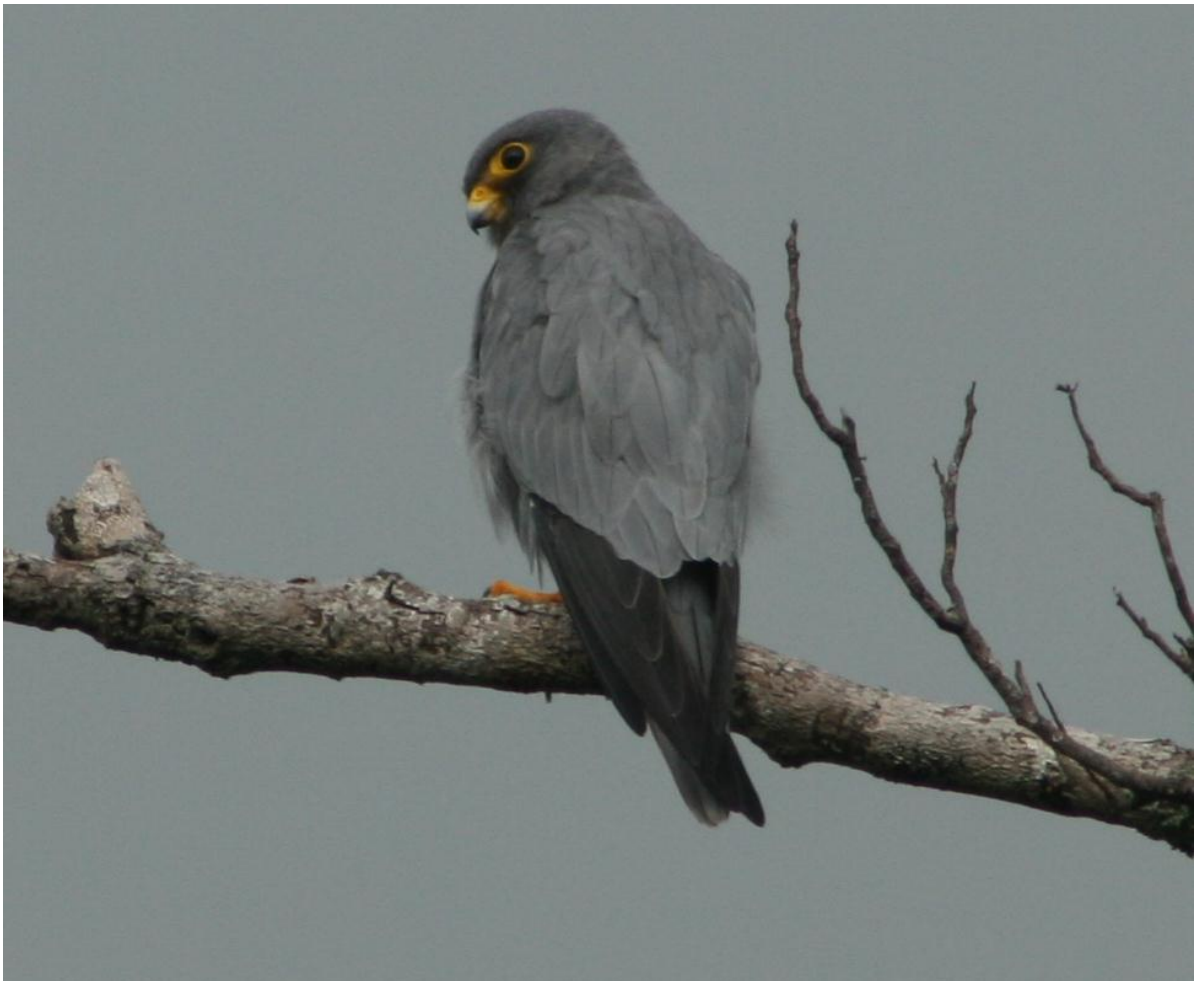
Faucon concolore adulte