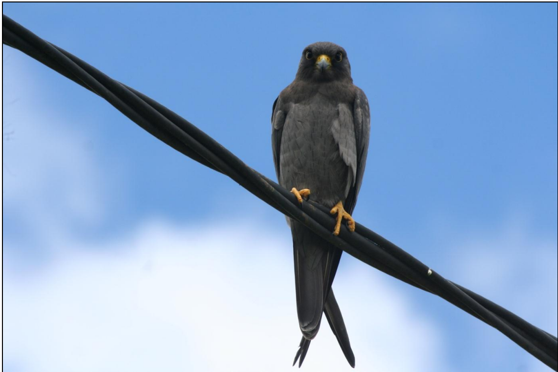
Adulte de Faucon concolore