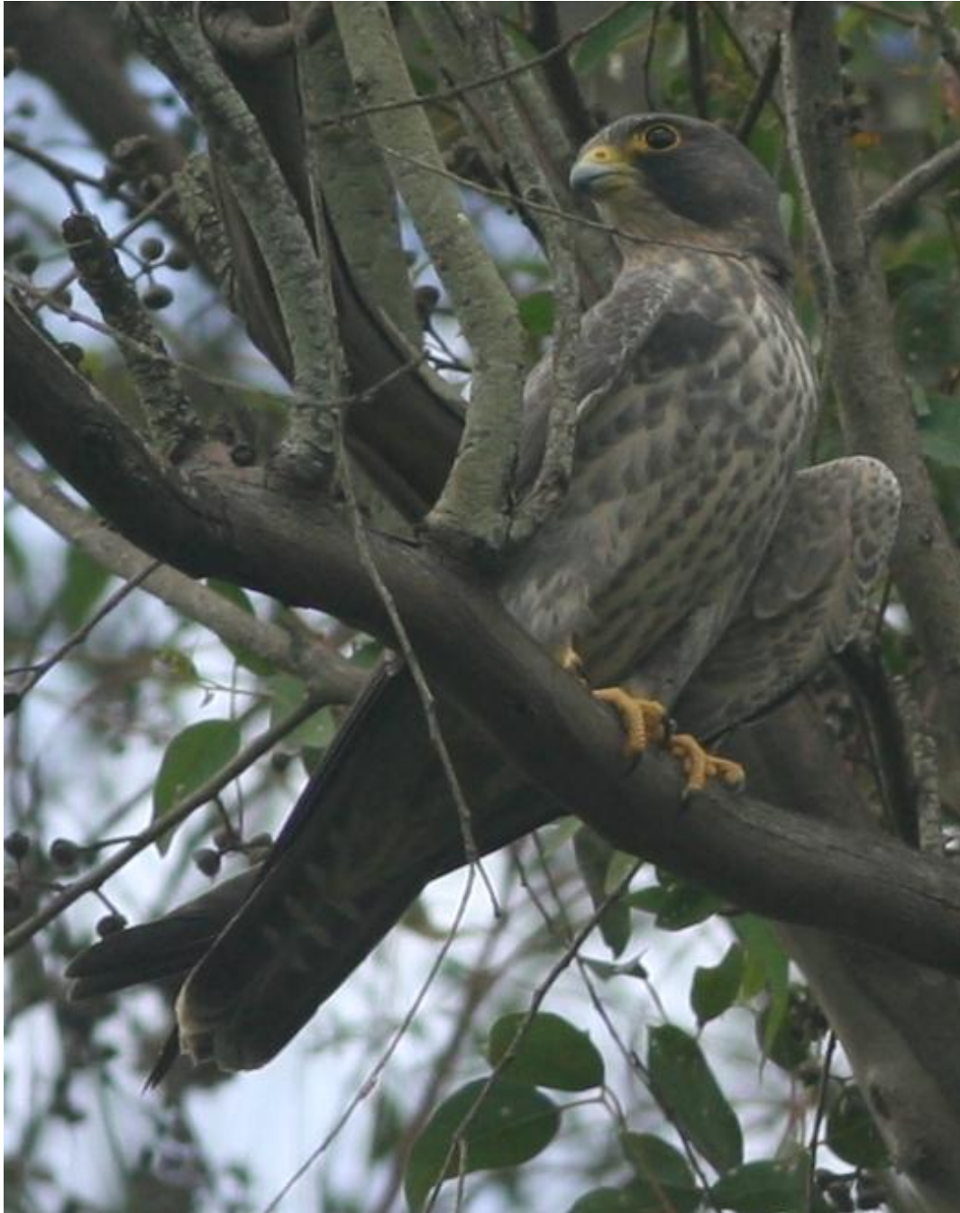
Juvénile de Falco concolor